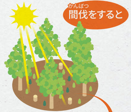
太陽光が隅々まで行き届き木々と土壌が健康になります。