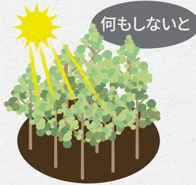
木々が密集し太陽光が差し込まず木々の成長を妨げます。